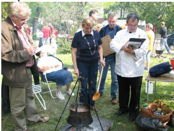
Gulyásfőzés a tavalyi búcsún

A gulyásverseny, amely eddig minden alkalommal jó hangulatban zajlott és évente növekvő versenyzői létszámmal büszkélkedhet, várhatóan most is sikeres lesz. Szeretettel várunk és biztatunk minden családot, baráti társágot, intézményt – egyszerűen minden közösséget, hogy képviseltessék magukat egy-egy csapattal a gulyásversenyen! Nevezni előzetesen a plébánián, de 24-én a templomkertben is lehet.