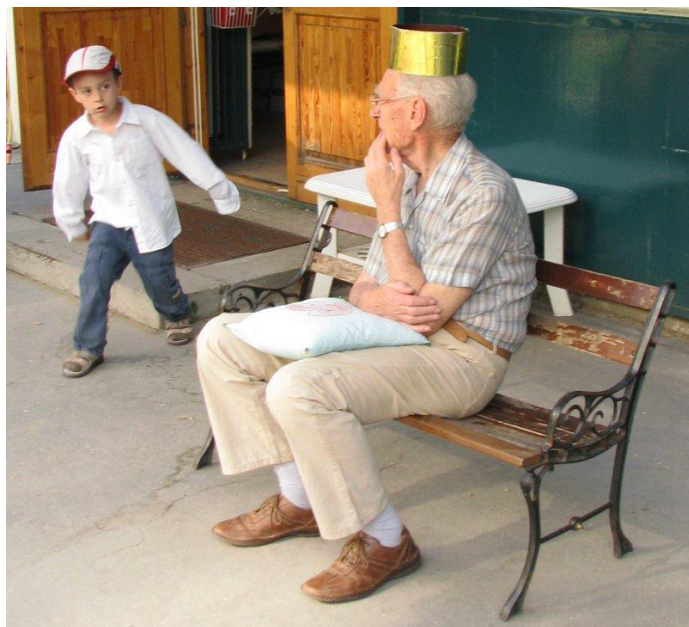
Egy nagypapa pünkösdi királysága

Az évzáró műsor után 3 iskolába készülő nagycsoportosainkat búcsúztattuk. Először a kis- és középső csoportosok búcsúztak tőlük verssel, majd a 3 óvodánkból ballagó nagycsoportosaink versekkel köszöntek el óvodájuktól, az óvodapedagógusoktól és a csoporttársaitól.